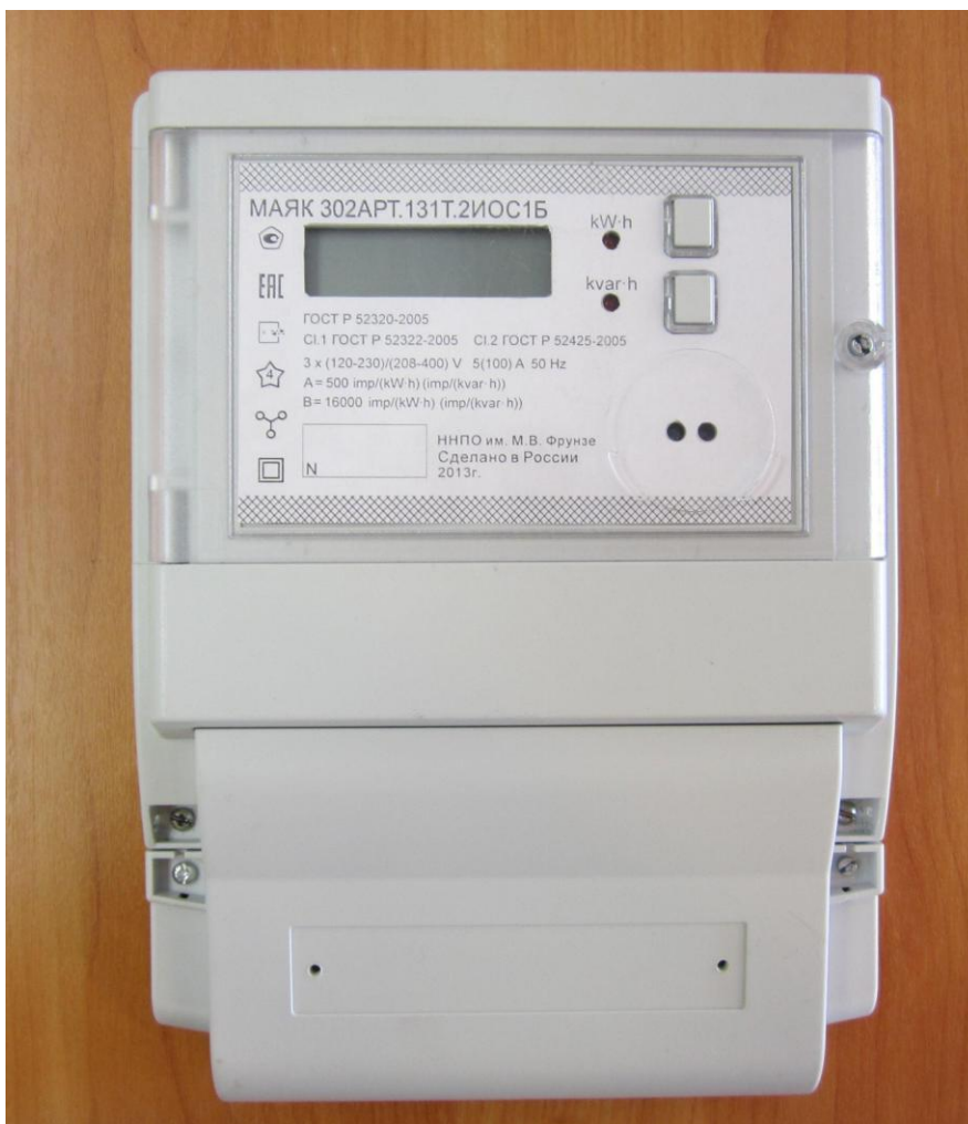
Рисунок 1 – Внешний вид счетчика с закрытой клеммной крышкой

Внешний вид счетчика МАЯК 302АРТ с закрытой клеммной крышкой приведен на рисунке 1.